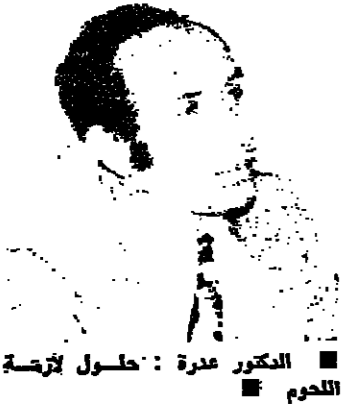
المكروم عدة: حلول لزيادة اللحوم